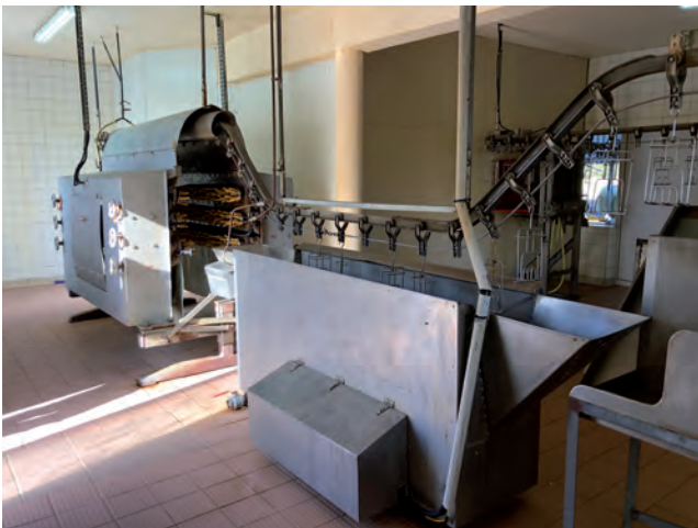
La maîtrise jusqu'au produit fini