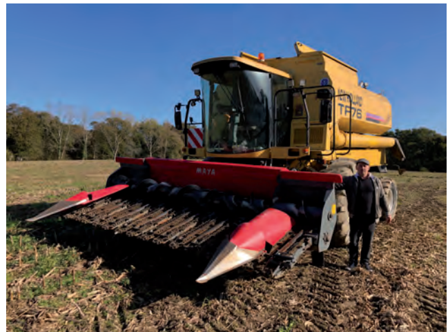
Pour permettre la récolte du maïs et satisfaire son élevage