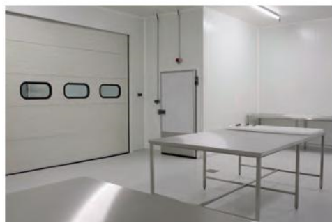
Laboratoire de découpe sous température dirigée sur notre site

N° Agrément sanitaire : FR 40.284.006 CE